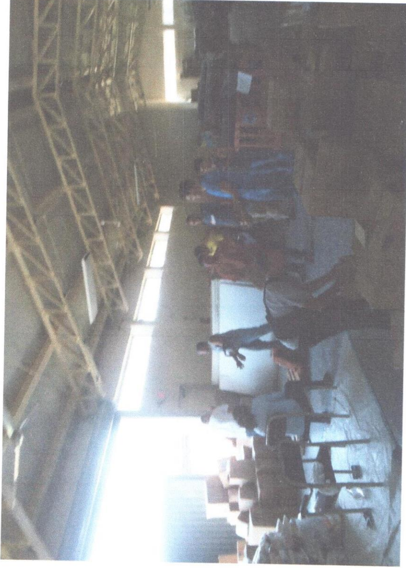
Descargando donaciones en bodega de Casa Presidencial en COPECO